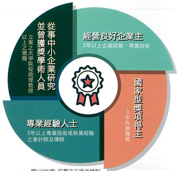
圖110年度 招募志工條件機制

榮譽指導員(企業服務志工)係為志願參與服務，且為無給職之聘任，以熱心公益並關心地方企業發展、具傳達政令及交換專業經驗之能力、無銀行拒絕往來及刑事犯罪紀錄、取得志工基礎訓練結業證明之人士，及符合下列條件之一者：